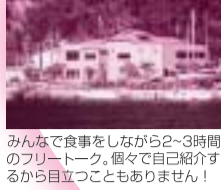
みんなで食事をしながら2-3時間のフリートーク。毎々で自己紹介するから目立つこともありません！